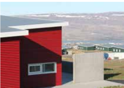
Bústaðurinn á Akureyri.

og sjá hvað er búið að gera þennan bæ flottan, gera upp öll þessi hús og koma upp söfnum. Hótelíð þeirra gerir ekkert nema fegra þennan flotta bæ, ef eitthvað er.