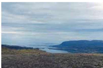
Séð yfir Breiðafjörð.

í náttúrunni en þetta eru sögur sem segi mínum erlendu gestum og vinum.